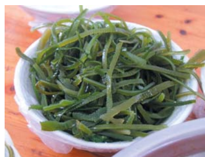
中国生产的海藻供应当地市场之余也出口到海外。