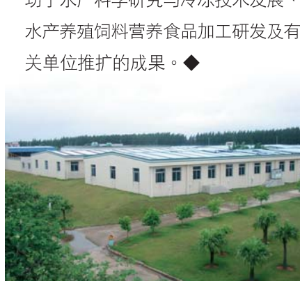
位于湛江的不带病毒(SPF)南美洲白对虾现代室内孵化生产基地。