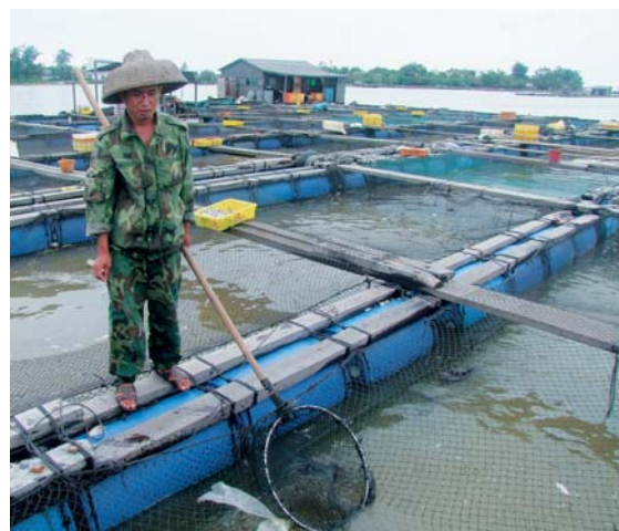
海上浮动网箱养殖是海南岛一种非常普遍的养殖水产方法。