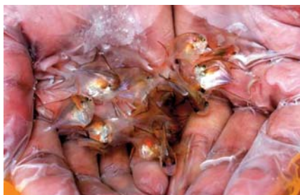
白鲳幼鱼不会互相残食，因此存活率高。