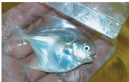
小鱼在 12 天内的食饵为轮虫，12 天过后则食用刚孵化的丰年虫。