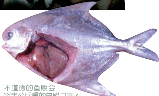
不道德的鱼贩会将半公斤重的白鲳口塞入铅粒，使这些鱼体重超过 800 克，赚取更高的利润。

鲳学名则称为 Formio niger ，属 Formionidae 科。据沙巴前渔业局总监陈培光所编《Marine Food Fishes And Fisheries Of Sabah》指出，白鲳的捕捞量在山打根和斗湖较多，捕捞渔具为鳃网、围网和拖网。潮汐从大潮转变死潮的时期，捕捞量较多。每年捕捞量约 800 吨。