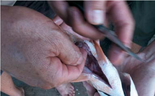
在捕捞成鱼出售或在海域捕捞到成鱼时，立即解剖观察生殖器官可判断种鱼的生殖期。

红鸡、金目鲈和狮头生殖孔和肛口则非常靠近，不易分辨。笔者培训的校友好几次在作实验分辨这几类海鱼时，常把PE软管插入种鱼的大肠，不自觉的用口大力在PE软管另一端出力一吸，结果把大肠内的粪便都吸入口中，只能大叹倒霉。海鲷成熟的卵子直径比以上4种鱼较大些。