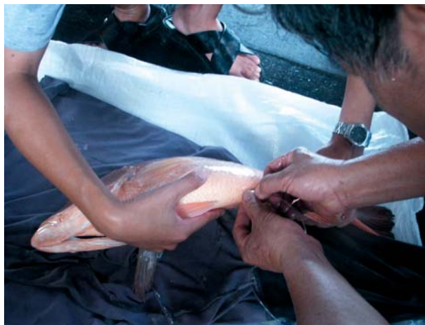
把PE软喉管插入种鱼生殖孔时要小心分辨肛门和生殖孔。

海鲷属于雌雄异体鱼，不变性，一只养殖2年约6公斤的成鱼，性便成熟，要测定性器官的成熟度也如同其他海鱼一样，即利用一条1.2mm的PE软喉管，插入腹部的生殖孔，吸取卵巢内细胞组织在显微镜下观察。海鲷的生殖孔和肛门有约2mm的距离，肉眼很易分辨，而红鳍、