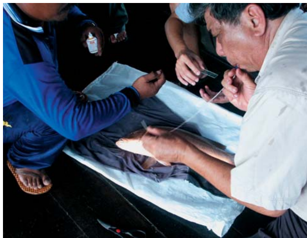
利用PE软喉管吸取种鱼性器官内含细胞组织以供检测性成熟度。