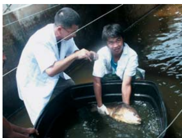
要进行手术的种鱼捞起安置在加入了麻醉剂的水槽中使之进入昏迷状况。