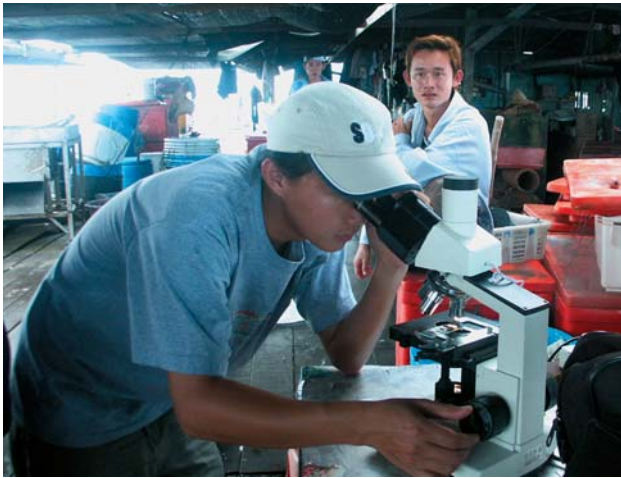
在显微镜下观察卵巢细胞组织形态，便可确定卵粒的成熟度。