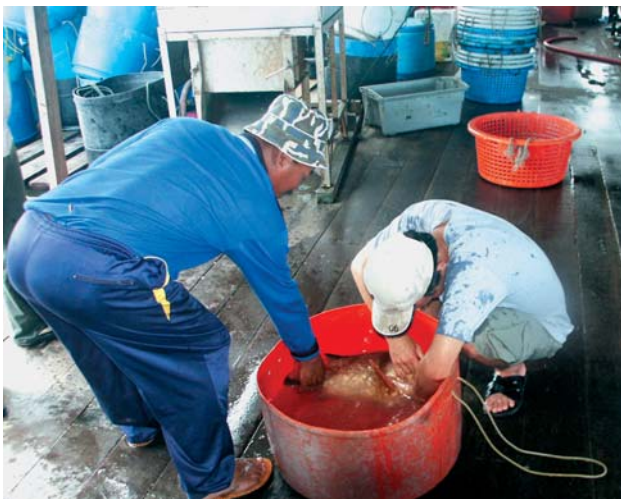
应用麻醉剂时，要拿捏准确施药浓度及昏迷时间，提防种鱼因用药过度而死亡。