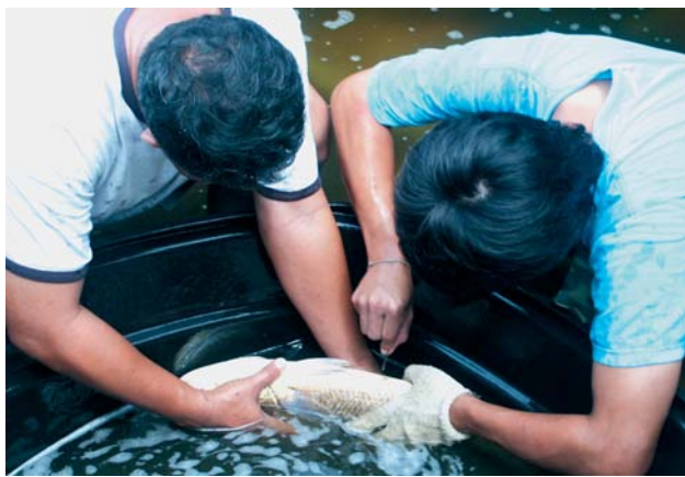
经过性成熟度测定后的种鱼便要马上注射催产荷尔蒙。

头及海鲷 4 种海鱼成鱼，供应给笔者让各培训员作为活教材，而在挑选这些种鱼时，成鱼的性都成熟了，从以上的实例证明在我国海域养殖的各类名贵鱼类，经过一段日子的养殖性都会自然成熟，而这些种鱼都可利用来催产提供大量的受精卵。